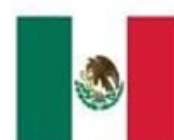
México Ciudad de México