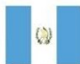
Guatemala Guatemala City